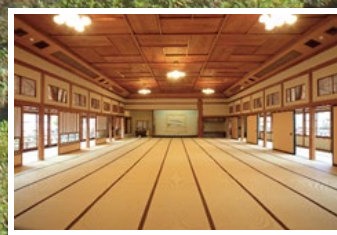
国登録有形文化財「旧料亭金勇」を見学