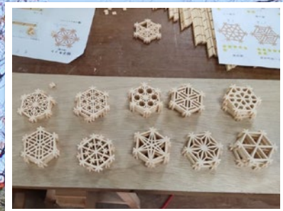
木都能代で「木工製作体験」