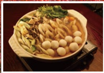
郷土料理「だまご鍋」づくり体験