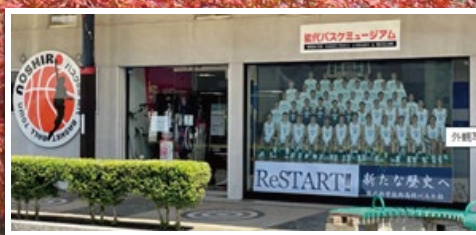
能代バスケットミュージアムを見学