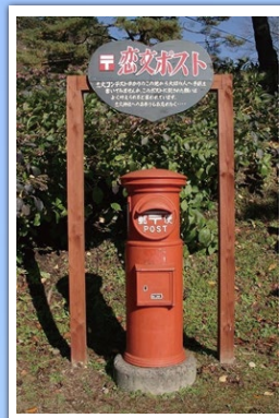
きみまち阪の縁結びスポット 「恋文ポスト」